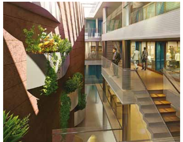
El emprendimiento prioriza la iluminación natural

20 años siendo la Primera y Única Cooperativa de Asesores en Seguros en el Uruguay