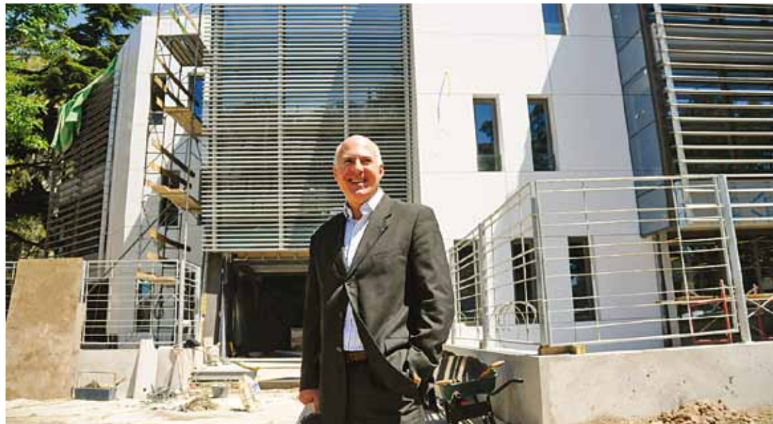
Un edificio con avanzada tecnología