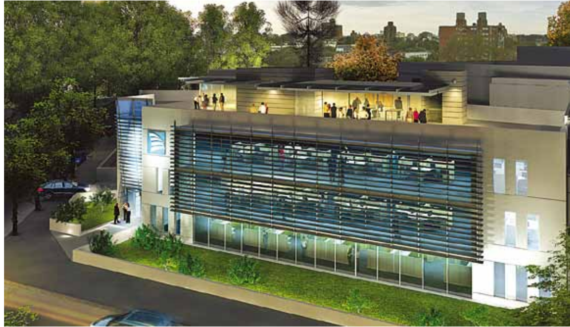
La construcción se compatibiliza con la naturaleza y con el entorno urbanístico

El edificio tiene un Data Center propio con certificación Tier 2. El concepto Tier marca